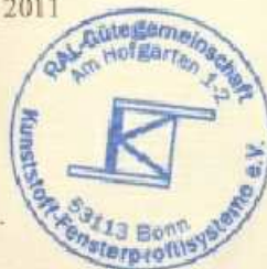
Klaus von Barby Obmann des Güteausschusses